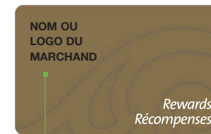
Nom ou logo du marchand

Des formulaires d'inscription vous ont été fournis afin de vous permettre de recueillir le consentement du client à participer à votre programme.