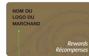
Nom ou logo du marchand

Vos cartes sont préactivées et prêtes à être utilisées. Nous vous recommandons de les entreposer dans un lieu sûr et de remettre une carte à un client uniquement une fois qu'il a signé le formulaire d'inscription et fourni ses renseignements personnels de base. Des formulaires d'inscription vous ont été fournis afin de vous permettre de recueillir le consentement du client à participer à votre programme.