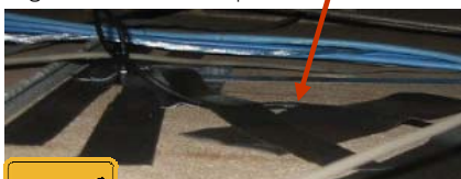
Figure 5B : Caméras miniatures dans le plafond