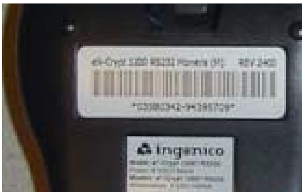
Figure 3B : Appareil trafiqué avec un port de communication et un commutateur DIP derrière l'étiquette.

Figure 3A : Dos d'un appareil standard. Passez les doigts sur l'étiquette à l'arrière pour voir si l'appareil semble avoir été trafiqué.